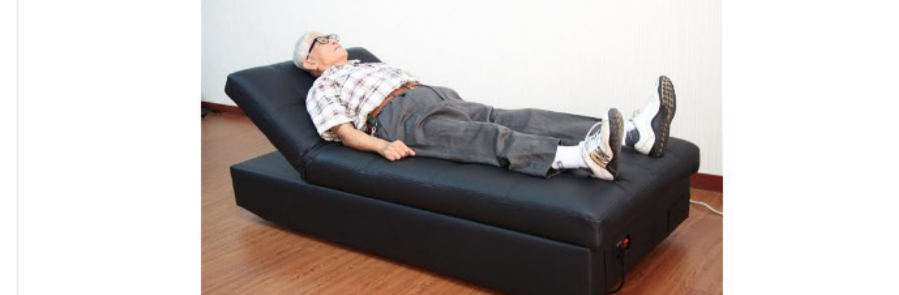
被動式運動適合一些銀髮族保健應用。圖為一氧化氮氣生儀。