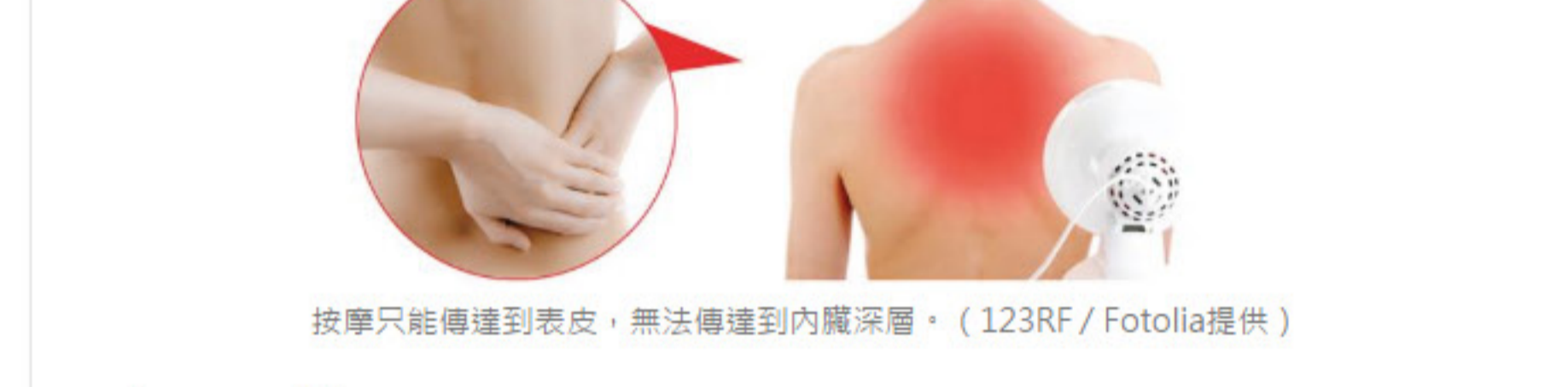
按摩只能傳達到表皮，無法傳達到內臟深層。

什麼運動具有「重力加速度」？跑步、跳繩、外丹功，凡是可以讓身體產生上上下下、具有重力加速度的運動，就是有效的運動，因為這些運動可以產生內臟按摩、腸胃蠕動和促進血液循環。