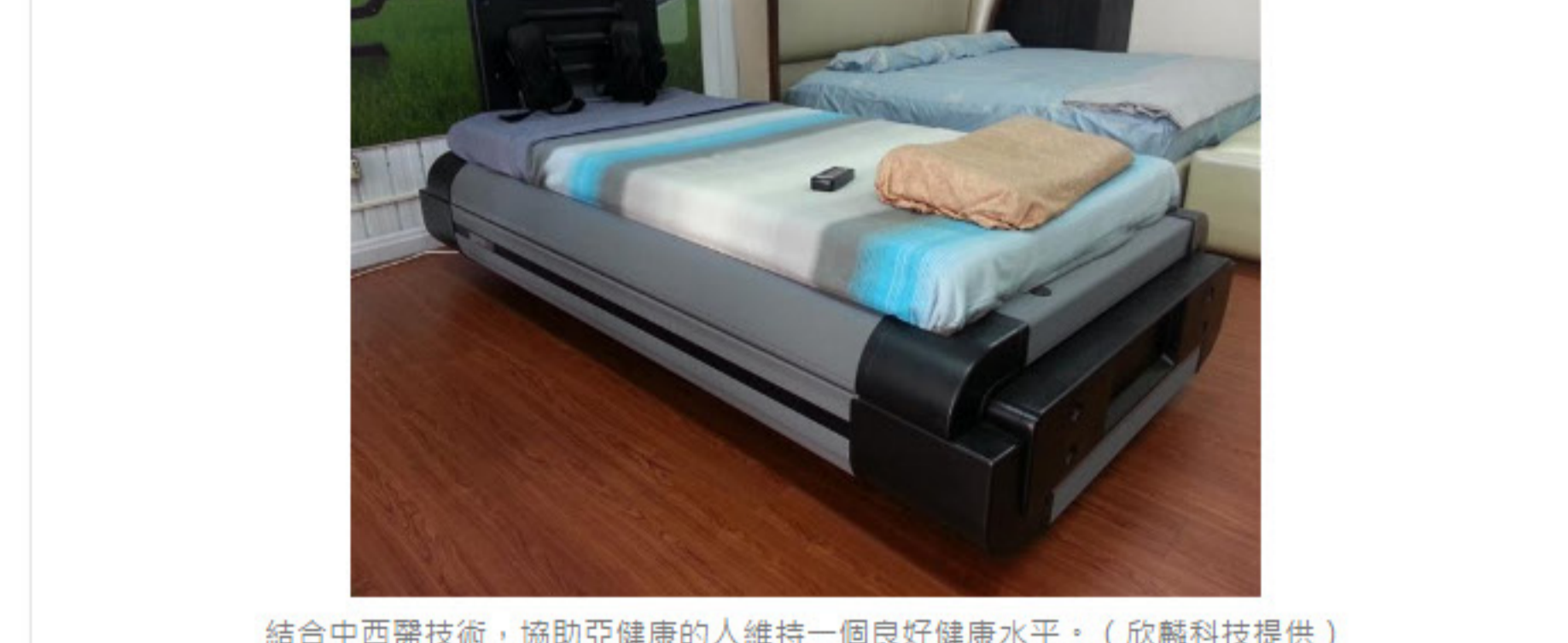
結合中西醫技術，協助亞健康的人維持一個良好健康水平。

震動是人類未來能量醫學研究中一項重要的研究方向，台灣有機會以被動式運動與震動，結合中西醫技術創新「能量醫學」產業，用以照顧廣大亞健康族群維持健康常態，提升健康生活品質。◇