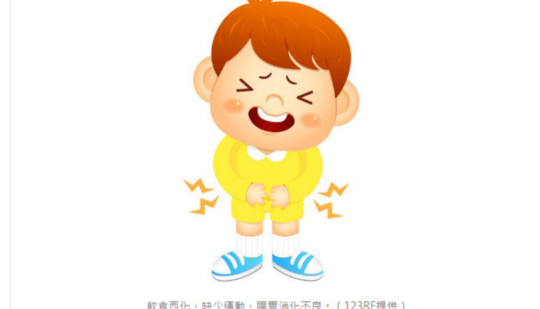
飲食西化，缺少運動，腸胃消化不良。

癌細胞的產生是經過相當久的時間慢慢轉變，如生活及工作壓力大產生自律神經失調，熬夜加上睡眠障礙，肝及內臟無法獲得有效休息保養，加上西化飲食油膩及氫化食物，喝酒、吃宵夜等，偏偏又缺少運動，睡覺時，腸胃食物尚未消化，長期缺少蠕動，身體怎麼受得了？