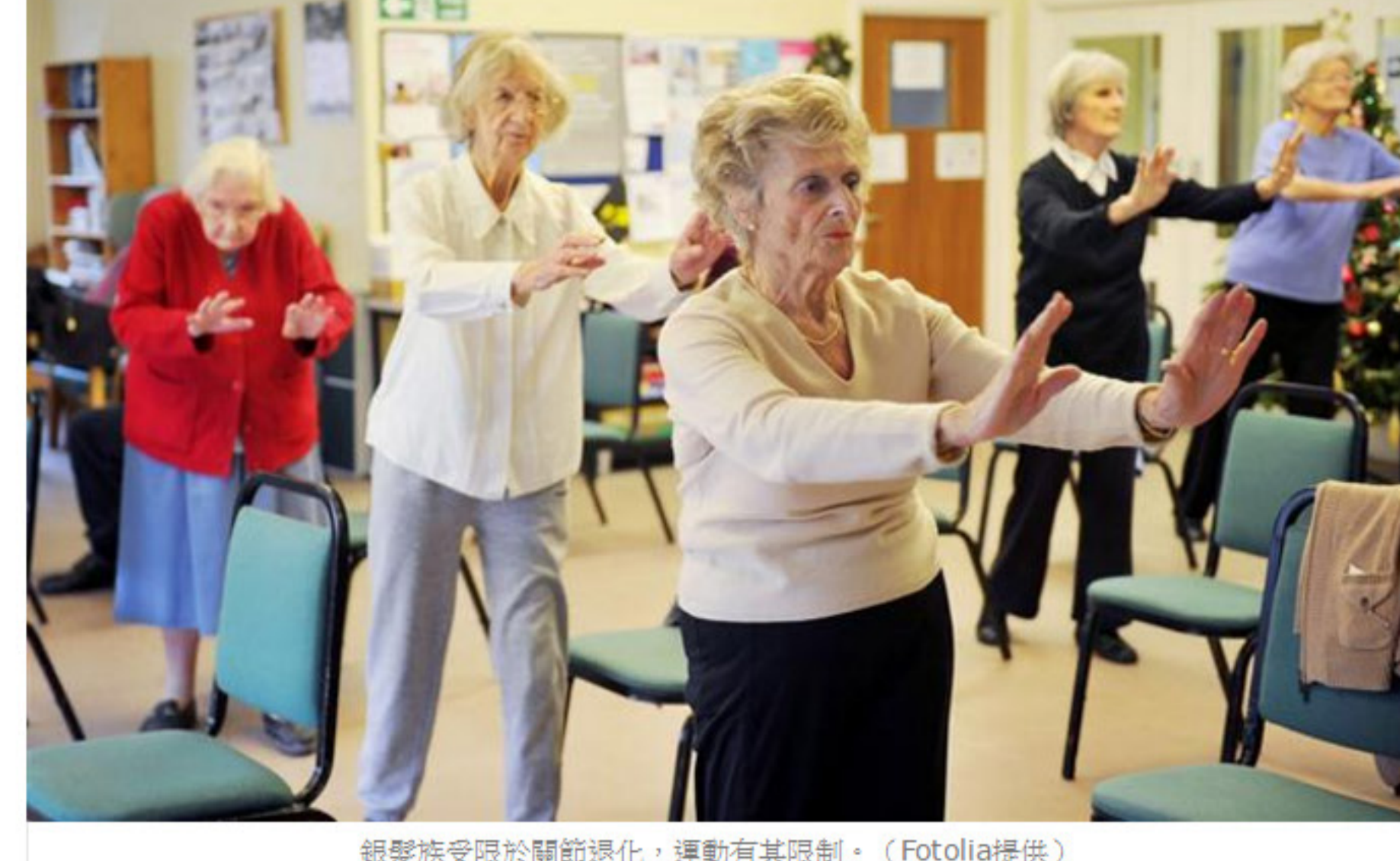
銀髮族受限於關節退化，運動有其限制。